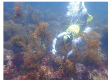
↑雑海藻を刈り取るダイバー

今年の潜水作業は6月に3地点で計9回行われ、雑藻刈りおよび効果のモニタリングが実施されました。モニタリング結果の詳細は集計中ですが、活動地点によってはテングサの着生量が昨年より増加していました。