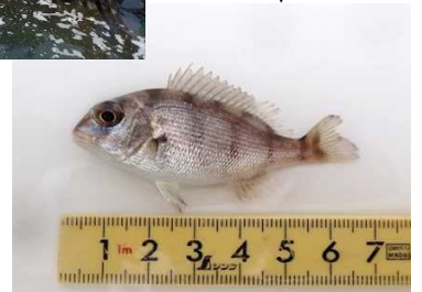
放流されるマダイ稚魚

解説：栽培漁業は、生残が悪い卵から稚魚までの間を人間が育てた後、自然へ戻して、成長したものを漁獲することで資源を持続的に利用することです。静岡県ではマダイ、ヒラメ、アワビなどが対象となっています。