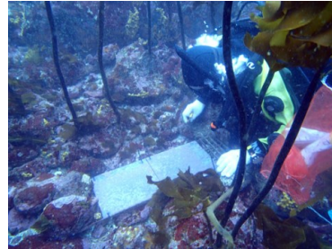
←海底に設置した稚貝採集用コレクター

アワビの産卵期は秋で、親から放出された卵は孵化し一週間程度浮遊生活を送った後、稚貝として海底に着底します。稚貝の着底を確認するために、海底にコレクターを設置して、コレクターに着底した稚貝の数を調べています。しかし、着底したばかりの稚貝は、大きさが0.3mmと非常に小さいため、見た目では種類を判別することができません。そこで、DNA分析により種の確認をした結果、メガイアワビの稚貝は、12月下旬から1月上旬に着底したことが分かりました。