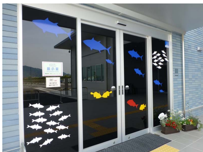
中は写真撮影可能です