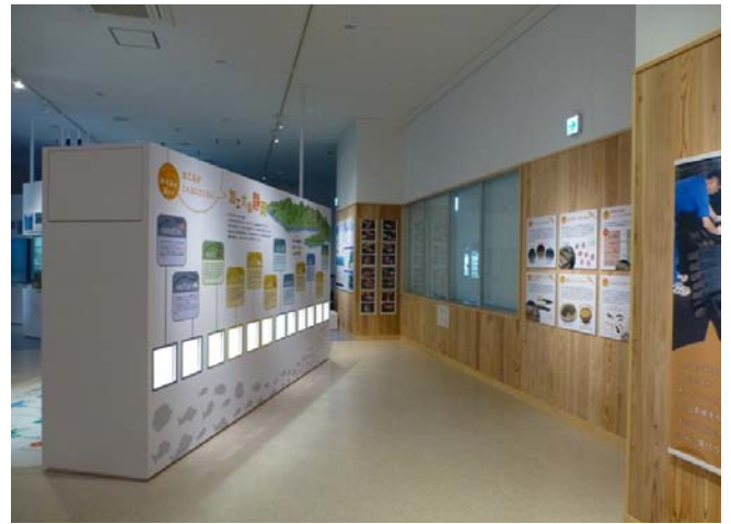
加工品紹介エリア