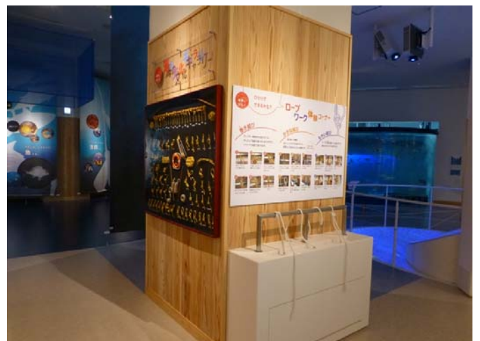
ロープワーク体験 (ロープは三本)