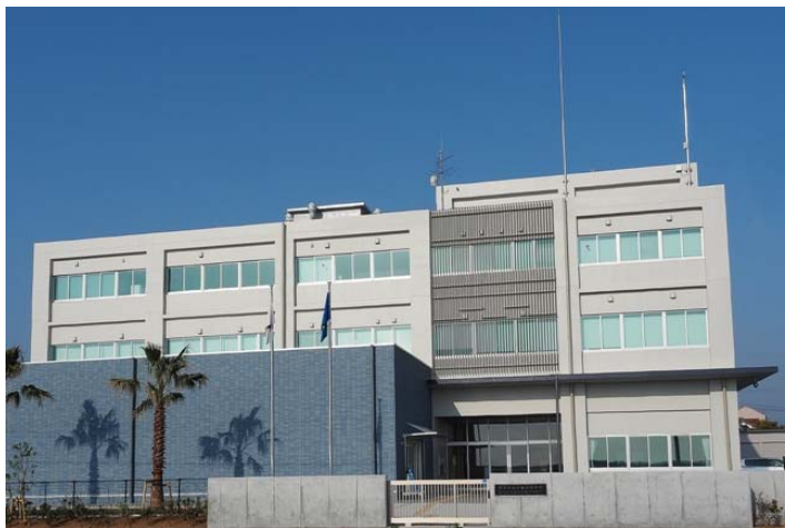
水産技術研究所全体（左手前の青い部分が展示室）