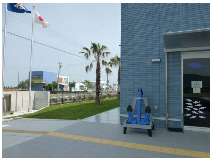
深層水ミュージアム（月曜定休）が はず向かいにあります