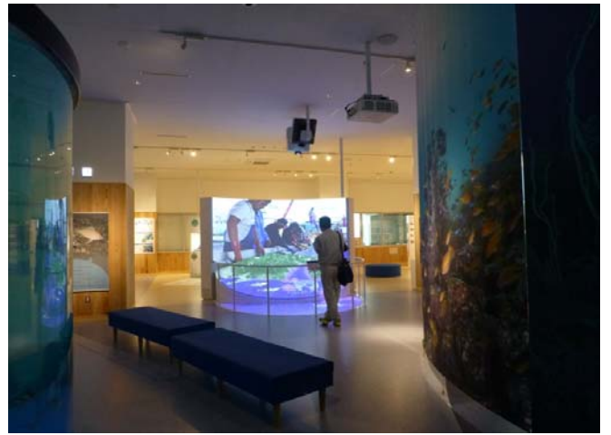
大水槽左側からの様子