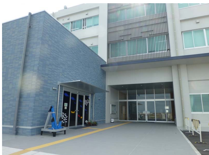
展示室及び事務所入口