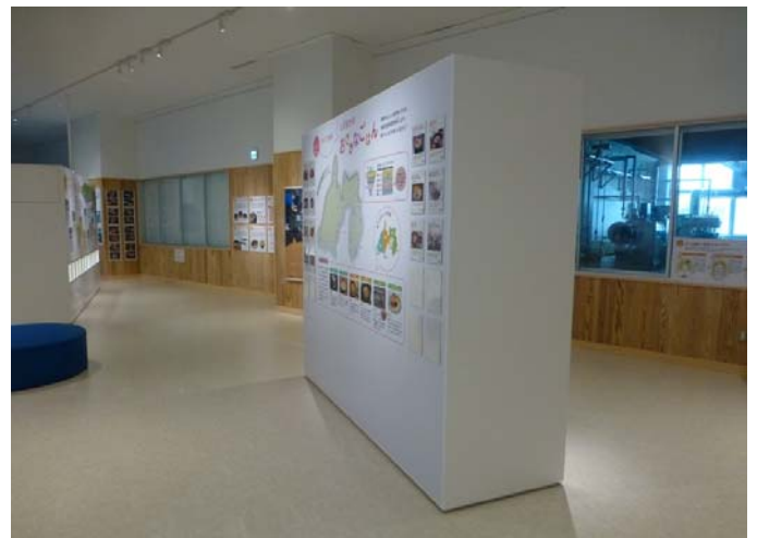
魚料理紹介エリア