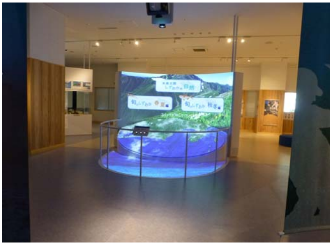
ジオラママッピング (静岡県の漁業や水産物を映像で説明)