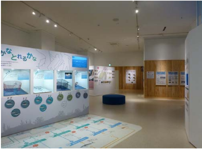
漁具、漁法の紹介エリア