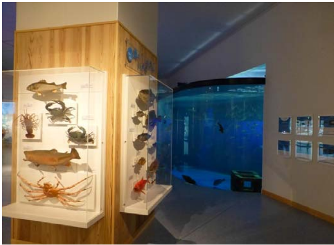
左：海のいきものギャラリー（標本）