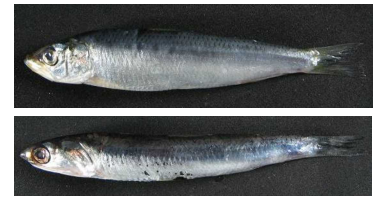
写真 マイワシ(上)と カタクチイワシ(下)