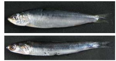
写真 マイワシ(上)と カタクチイワシ(下)