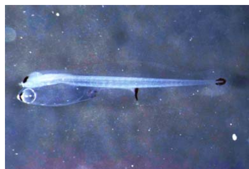
写真1 キンメダイ仔魚(日齢0)