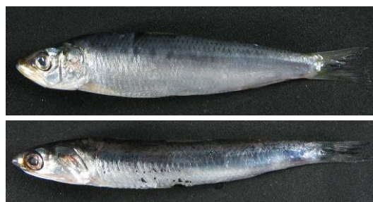
上：マイワシ、下：カタクチイワシ