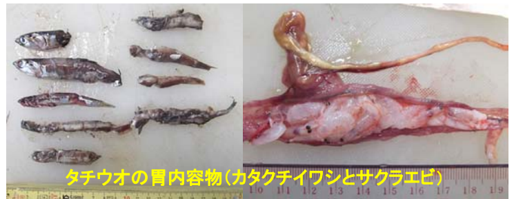
タチウオの胃内容物（カタクチイワシとサクラエビ）

稚魚は動物プランクトンを、未成魚はオキアミ類やアミ類、エビなどを主餌料としています。成魚は魚食性の傾向が強くなり、特にイワシ類、サバ類、アジ類、サイウオ類などを多く捕食します。