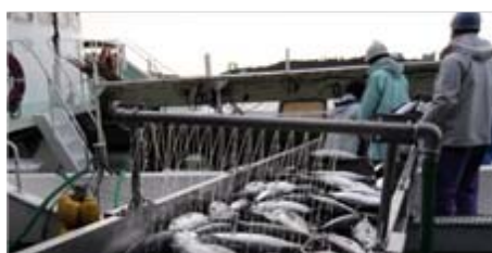
竿釣り船の水揚げ

成熟体長は生息域で異なり、熱帯域で50.1cm、亜熱帯域で53.7cm、温帯域で55.9cmです。