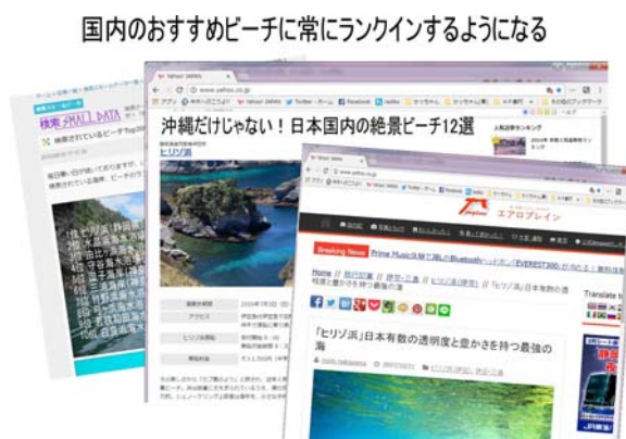
図5 おすすめビーチにランクイン

しかし、一方で観光客の増加に伴い、さまざまな懸念も生じた。その一つが「渡船対応の複雑化」である。「ヒリゾ浜」は船でしか渡れないビーチなので、観光客は前もって渡船を予約して浜に渡っていたが、観光客が多くなると、誰をどの渡船が対応するのか分からなくなり、混乱が生じるようになった。そこで、予約の受付を統合し、渡船を行う漁船8隻が協同して組織的に対応できるような体制を構築した(図6)。さらに、観光客の安全に配慮し、渡船の期間は7月第1週土曜日~9月末日曜日と定め、期間中は監視船を常駐させるようにした。加えて渡船スタッフは救急救命講習を受講し水難事故防止に努めてい