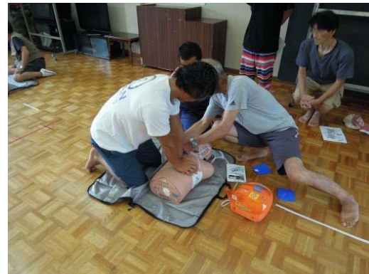
図 7 救命救急講習

もう一つの懸念が「環境悪化」である。そこで、南伊豆の美しい海を守る活動を組織的に行うため、NPO 法人伊豆未来塾と連携し平成 25 年に「伊豆 FNY 活動組織」（図 8）を結成した。伊豆 FNY の主な活動は、漁業者と地域住民と一体になって行う海岸清掃やダイバーによるサンゴの生育場所や種類、個体数等の調査である。さらに、観光客にサンゴ保護に関する啓発パンフレットを配りサンゴを傷つけないよう呼びかけを行っている。また、最終の渡船が終わった後に、海岸清掃を毎日行い、いつでも美しい海岸を楽しんでもらえるよう徹底して管理している。また、ホームページでは「ヒリゾ浜」の紹介と併せて、イセエビやアワビ等の採取の禁止、モリの使用禁止などを記載するとともに、バーベキューの禁止、ゴミの持ち帰り等、海のルールを守るよう注意喚起を行っている。こうした取組の結果、観光客が増えても浜は荒れることなく、美しい景観が保たれている。マナーの行き届いたビーチが評判を呼びさらなる人気向上にもつながっている。