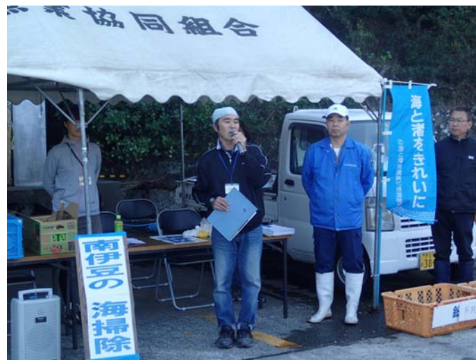
図 8 伊豆 FNY の活動(海岸清掃)

もう一つの懸念が「環境悪化」である。そこで、南伊豆の美しい海を守る活動を組織的に行うため、NPO 法人伊豆未来塾と連携し平成 25 年に「伊豆 FNY 活動組織」（図 8）を結成した。伊豆 FNY の主な活動は、漁業者と地域住民と一体になって行う海岸清掃やダイバーによるサンゴの生育場所や種類、個体数等の調査である。さらに、観光客にサンゴ保護に関する啓発パンフレットを配りサンゴを傷つけないよう呼びかけを行っている。また、最終の渡船が終わった後に、海岸清掃を毎日行い、いつでも美しい海岸を楽しんでもらえるよう徹底して管理している。また、ホームページでは「ヒリゾ浜」の紹介と併せて、イセエビやアワビ等の採取の禁止、モリの使用禁止などを記載するとともに、バーベキューの禁止、ゴミの持ち帰り等、海のルールを守るよう注意喚起を行っている。こうした取組の結果、観光客が増えても浜は荒れることなく、美しい景観が保たれている。マナーの行き届いたビーチが評判を呼びさらなる人気向上にもつながっている。