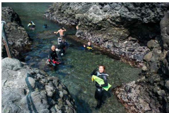
図4 変化してきた客層

「ヒリゾ浜」は交通の便が悪く辺鄙(へんび)な場所にあるが、20年以上前に「伊豆の秘境、プライベートビーチ」としてテレビで紹介されてから徐々に全国にその名を知られるようになったことから、私たちはヒリゾ浜を観光の目玉とし、観光客の呼び込みを図ろうと考えた。そこでまず取り組んだのが、平成9年から開始したホームページでの「ヒリゾ浜」の紹介である。当時、インターネットの普及率は低かったが、「青く綺麗な水」「群れる美しい魚」の写真を紹介した。その後も、インターネットの普及に合わせ、画像の多い綺麗なページを設けるなど、ホームページに工夫を懲らしたことで、さらに多くの方の注目を集めるようになった。また、その頃から客層が「家族連れ」や「水着に浮き輪スタイル」から「ウェットスーツに防水カメラスタイル」に変化してきた(図4)。これがきっかけで、首都圏からシュノーケリングを目的とする観光客が多く集まるようになり、人気、知名度はさらに上昇した。平成27年のビーチランキングTOP300(YAHOO JAPAN調べ)では、2位に圧倒的な差をつけて1位を獲得した。ホームページを活用した取り組みは予想以上の大きな効果を生み、当初観光客は年間3,000~4,000人程度であったが、現在では3万人が訪れるようになった(図5)。