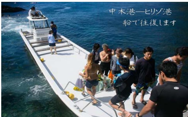
図 6 渡船の様子

る（図 7）。最近では、大型船の新造も行い、より円滑に観光客を案内できるような取組も進めている。