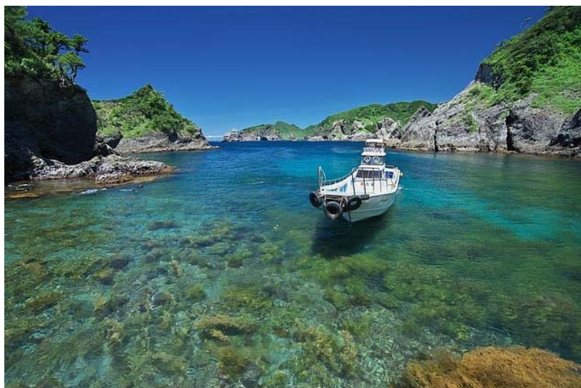
図3 美しいヒリゾ浜の海岸

南伊豆町の中木(なかぎ)地区は古くからイセエビの刺し網漁業やサザエ、アワビ等を対象とした採介漁業が行われており、これら漁獲物を提供する民宿業を営む人たちも多い。こうした海の幸、海水浴などの海上レジャーを目的に観光客が訪れるが、中でも特に穴場の観光スポットが「ヒリゾ浜」である。ヒリゾ浜は、人が容易に立ち入れない切り立った崖に覆われた、ありのままの自然が残る海岸で(図3)、多くのサンゴが生息しており、20年ほど前から絶好のシュノーケリングポイントとして知られている。私たちは美しいこのヒリゾ浜を全国に誇れる「中木地区の観光資源」として、多くの観光客を呼び込むことで、地区ににぎわいを創出したいと考えた。また、多くの観光客が訪れても海岸の美しさが損なわれないよう、環境保全の活動もより一層強化すべきと考えた。