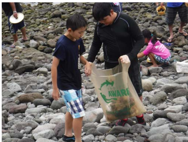
図9 水産教室で海岸清掃活動

また、子どもたちに南伊豆の海の素晴らしさを伝えるために、地元の小学生を対象に開催している「水産教室」では、毎年海開き直前に「ヒリゾ浜」に渡り海岸清掃（図9）や磯生物観察等を行っている。子どもたちは「ヒリゾ浜」の綺麗な水、生物の多様さを実感し、この浜の環境をいつまでも保っていきたいという気持ちを強く持つようになってきている。このような活動から南伊豆の宝である「ヒリゾ浜」を未来へ次の世代へ引き継いでいきたいと考えている。