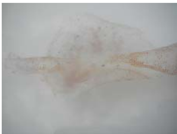
写真2 ヒレ部の拡大写真