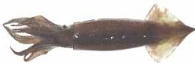
スルメイカ Todarodes pacifica

平成18年のスルメイカの漁獲量は、1、2、8月を除き平均値を下回りましたが、1月は100トンを上回りきわめて高水準でした。